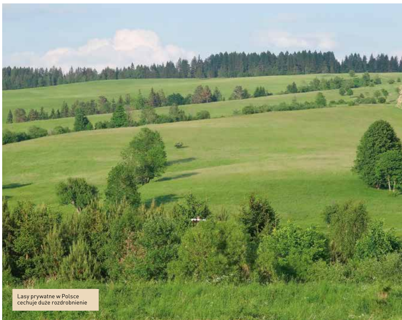
Lasy prywatne w Polsce cechuje duże rozdrobnienie